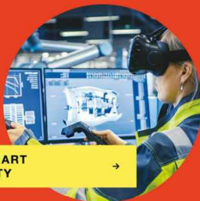
SMART CITY →