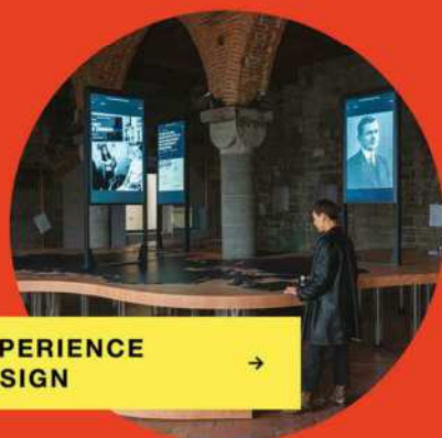
EXPERIENCE DESIGN →