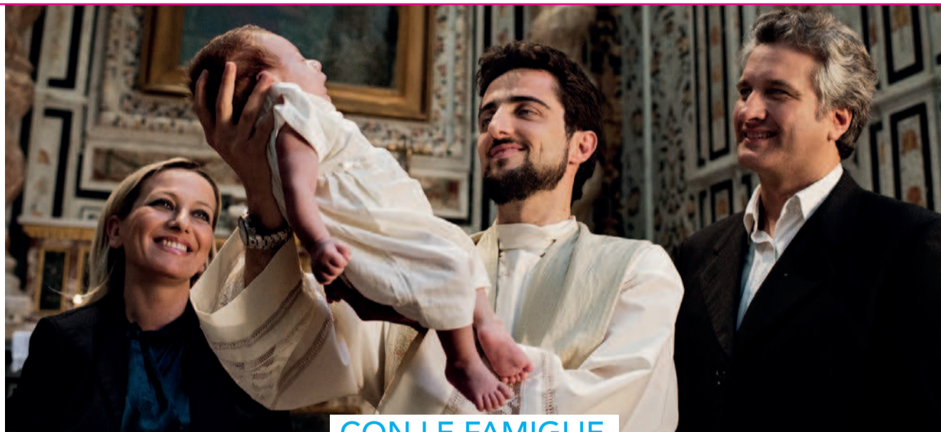
CON LE FAMIGLIE

Segui la missione dei sacerdoti su www.facebook.com/insiemeaisacerdoti