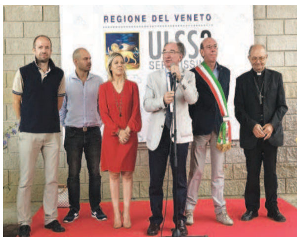
SCHEDE. 2012-2019: gli interventi sull'Ospedale "Madonna della Navicella" - Chioggia.

si trova in spiaggia: presenta tutte le sue specialità, con gli anni, anche rinnovate tecnologicamente e strutturalmente, garantendo così una risposta veloce ed efficace". Nella stessa occasione si è inaugurato l'ampliamento del parcheggio dell'Ospedale (in totale ora conta di 500 posti auto) e si è dato il via al proseguo dei lavori per l'adeguamento sismico.